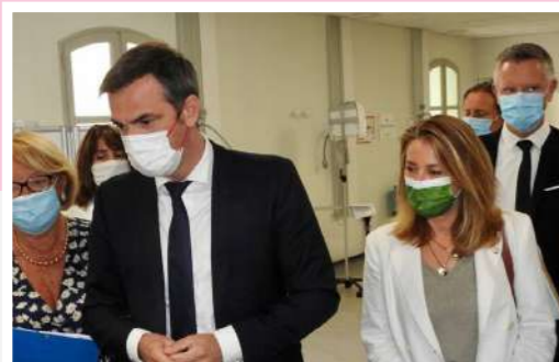
Anne-Laurence Petel avec le ministre de la santé Olivier Véran au Centre hospitalier du Pays d'Aix

x2 Pour une médecine de proximité, nous avons doublé le nombre de maisons de santé et levé le numerus clausus afin de former plus de médecins.